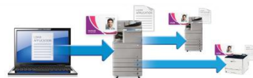
Evita dejar documentos con información financiera confidencial en las bandejas del dispositivo.

Los datos de los clientes en las solicitudes son altamente confidenciales. Cada día se intercambian grandes volúmenes de información sensible entre personal del banco e instituciones financieras. Gracias a uniFLOW, los bancos ya pueden garantizar que sólo el personal de la sucursal con requisito de autenticación ante el dispositivo pueda liberar e imprimir aquellas solicitudes de determinados clientes y otros documentos confidenciales.