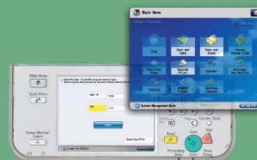
Los usuarios con el software Access Management System pueden restringir las funciones del dispositivo a determinados usuarios.

Con Canon Access Management System (AMS), las empresas de servicios financieros ya pueden restringir el acceso de los usuarios a las funciones de los dispositivos configurados a reglas pre-determinadas, incluyendo las definidas en el Active Directory. De este modo, un gerente de banco puede tener acceso a todas las funciones, incluidas las funciones de fax y envío, mientras que se puede restringir el acceso a determinado personal del banco a copias e impresión, así como bloquear el acceso total a los trabajadores subcontratados.