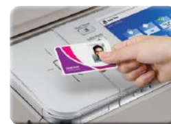
Limitar el acceso a dispositivos al personal autorizado.

Con la tecnología Universal Login Manager (ULM) y uniFLOW, las entidades financieras pueden controlar el acceso total al sistema multifuncional para imprimir, copiar, escanear o enviar documentos restringidos. Las soluciones Canon te permiten configurar las opciones de autenticación y de control de acceso, adaptables y compatibles con distintos sistemas de contraseñas y tarjetas, como las tarjetas de proximidad.