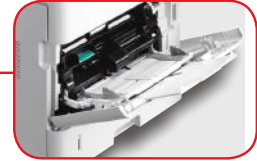
Bandeja Multipropósito de 100 hojas