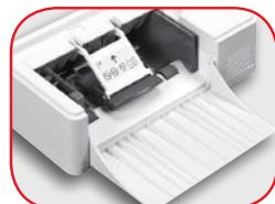
Alimentador de Sobres para 75 hojas, opcional*