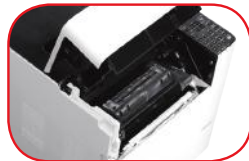
Sistema de cartucho de carga frontal fácil