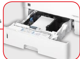
Casete para materiales personalizados