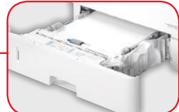
Casete estándar de 500 hojas