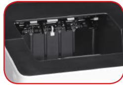
Bandeja de salida de 500 hojas