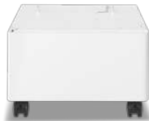
GABINETE TIPO P OPCIONAL