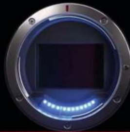
12 PINES DE COMUNICACIÓN

Los 12 pines permiten una mayor velocidad de comunicación entre la cámara y el lente, permitiendo un AF increíblemente rápido, alto ISO y una optimización de la imagen.