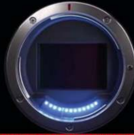
12 PINES DE COMUNICACIÓN

Los 12 pines permiten una mayor velocidad de comunicación entre la cámara y el lente, permitiendo un AF increíblemente rápido, alto ISO y una optimización de la imagen.