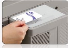
Lector de tarjetas