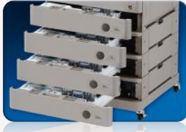
Acceso al papel mediante un botón