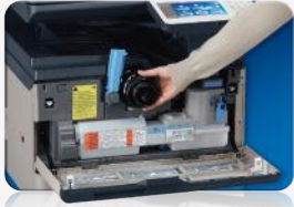
Fácil acceso al tóner