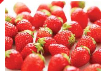
Producto Canon predecesor sin la Tecnología de Color V 2