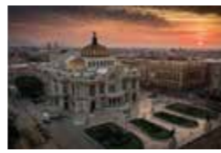
DURANTE LA EXPOSICIÓN