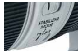
Selector de modo de estabilizador de imagen