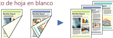
Dos documentos con una cara en blanco Hojas blancas no son escaneadas