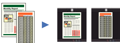
Hojas de diferentes tamaños Tamaño ajustado automáticamente